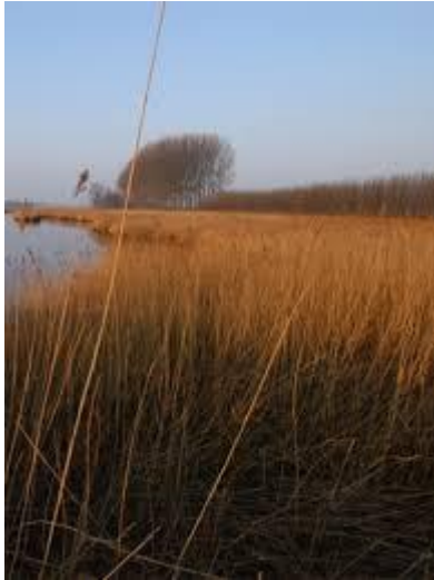
Rietzoom (Poldernatuur Zeeland)

Rietzomen bestaan uit smalle rietstroken die grenzen aan agrarisch gebruikte percelen. Vanwege een extensief gebruik zijn ze een belangrijk broedgebied voor rietvogels en daarnaast zijn ze van belang voor amfibieën, de ringslang, libellen en moerasvegetaties.