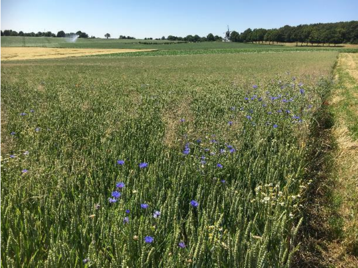
Hamstervriendelijk graan

Voor hamsters is het van belang dat er voedsel, veiligheid en dekking in de winter is. Dat kan door op bouwland graan en luzerne te telen. Een deel van de percelen mag worden geoogst, maar op hamstervriendelijke wijze.