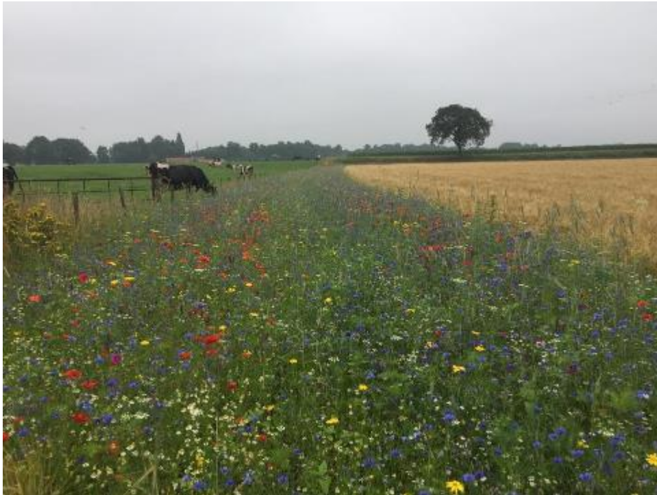
Kruidenrijke akkerrand

In akkerranden wordt geen gewas geteeld. Ze zijn ingezaaid met een mengsel van grassen, kruiden en granen. Ze worden niet bemest en niet bespoten (uitgezonderd pleksgewijs). Akkerranden brengen het mozaïekpatroon terug in het cultuurlandschap en zijn positief voor akkervogels. Vanwege de geringere bodemverstoring en de grotere bufferwerking boeken brede, meerjarige akkerranden meer natuurresultaat dan smalle, eenjarige randen.