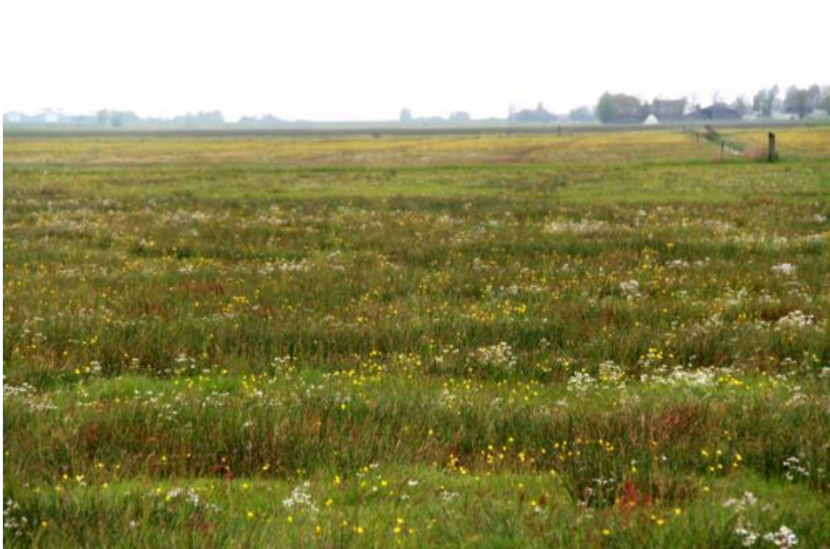
Kruidenrijk grasland

Op kruidenrijke graslanden komen de kruiden van nature in grotere aantallen voor en zijn verspreid over het hele perceel. De zode is open en divers van structuur door de vele kruiden met veel bloei-stengels en weinig blad. Dit heeft ook als voordeel dat kuikens zich goed kunnen voortbewegen in het grasland.