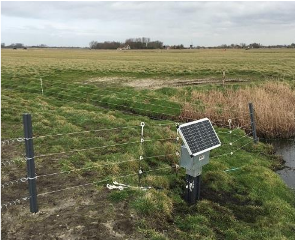
Vossenraster, collectief Water, Land en Dijken

Predatierasters om grondpredatoren te weren moeten worden onderhouden: gras onder het raster wegmaaien en het raster controleren op draden en spanning. Rasters staan veelal om een aantal beheereenheden met weidevogelmaatregelen geplaatst. De vergoeding voor het pakket betreft het plaatsen, onderhouden en weer verwijderen van het raster. Het is belangrijk je goed te laten informeren over het type raster, de plaatsing en het onderhoud zodat het past bij het mozaïek en de doelsoorten. Het (onderhoud van het) raster mag de rust op het perceel niet verstoren.