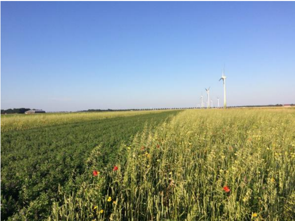
Vogelakker in Flevoland, vogelakkers zijn ontwikkeld door de Werkgroep Grauwe Kiekendief

Vogelakkers zijn bedoeld voor muizenetende roofvogels en uilen, maar ook broedende veldleeuweriken en overwinterende akkervogels worden door Vogelakkers aangetrokken. Om goed te functioneren moeten vogelakkers meerdere jaren op dezelfde plek liggen, zodat de muizenpopulatie zich kan opbouwen. Een vogelakker moet na een paar jaar vernieuwd of verplaatst worden. Voor het laatste jaar kan pakketvariant b gebruikt worden, zodat in het najaar de grond bewerkt kan worden.