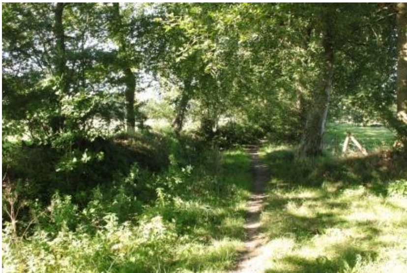
Houtwal in Noordlike Fryske Wâlden ( http://www.noardlikefryskewalden.nl/over-nfw/ )

Beschadiging van het wallichaam door vertrapping of aanvreten van de vegetatie door vee moet worden voorkomen door het plaatsen van een raster. Als er geen vee loopt, is een raster niet nodig.