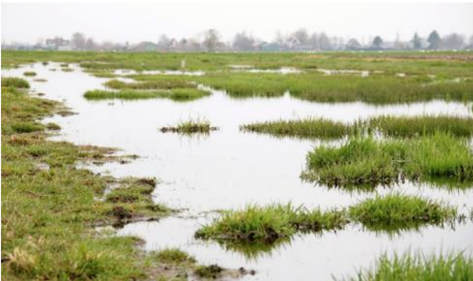
Plas dras in Krimpenerwaard

Het pakket met startdatum 15 februari heeft als voordeel dat de plasdras aanwezig is bij de start van het weidevogelseizoen, het pakket met startdatum 1 maart biedt een langere tijd voor de ontwikkeling van de bodemfauna. De plasdrassen in de periode mei-augustus hebben een functie als opvethabitat voor de vogels. De plasdras in november-december is bedoeld voor overwinterende soorten zoals de Kleine zwaan.