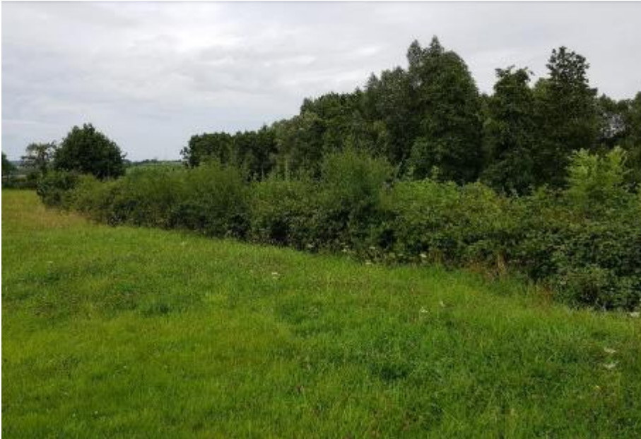
Struweelrand langs struweel

Door het extensieve beheer van deze randen is er veel rust en dekking. Bloeiende ruigtekruiden trekken veel insecten en daarmee vogels. Solitaire struiken zijn voor vogels ideale uitkijk- en zangposten en bieden nestgelegenheid.