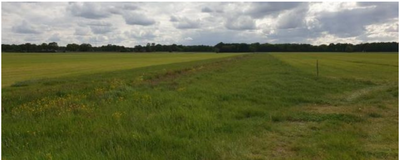
Kuikenveld: strook niet gemaaid gras

De vergoeding voor dit last-minute beheer met uitgesteld maaien begint te lopen vanaf 16 mei. Kuikenvelden worden bij voorkeur beheerd als vervolg op legselbeheer op grasland, registreer ze dan onder pakket 4 – Legselbeheer.