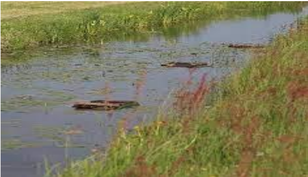
Nestvlotjes voor Zwarte stern

De rustperiode op de aangrenzende oevers duurt tot minimaal 1 juli. Als er vóór 15 juni geen nesten aanwezig zijn op de vlotjes, zullen er geen broedpogingen meer komen en kan de rustperiode tot 15 juni duren.