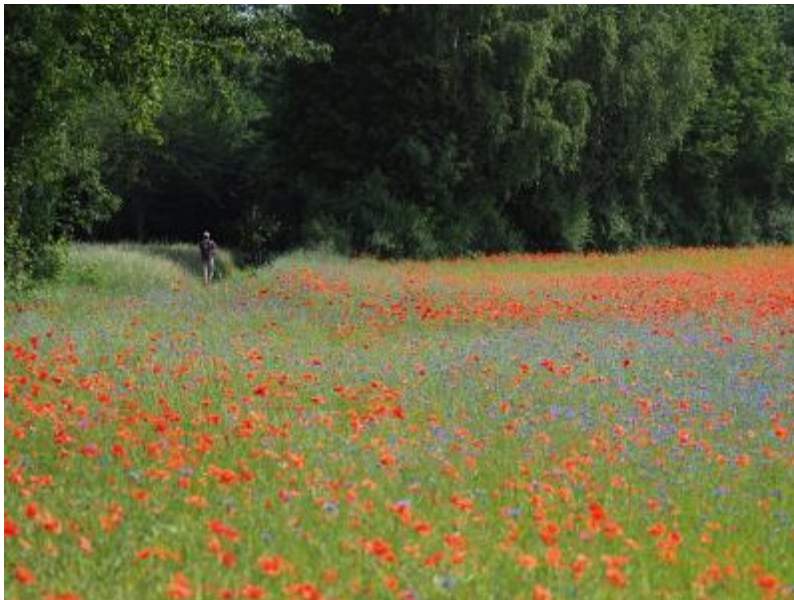
Foto Florarijke akker

De granen dragen ook bij aan doelstelling klimaat. Doordat granen diepe wortels hebben, dragen ze bij aan een bodemstructuur die zorgt voor goede doorlatendheid voor water. Tevens hebben diezelfde wortels ook een gunstig effect op de hoeveelheid koolstof in de bodem.