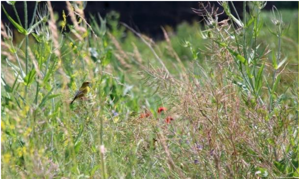
Bloemenblok in de zomer

Bloemenblokken bieden voedsel, veiligheid en voortplantingshabitat. Vogels vinden er veilige broedgelegenheden en voedsel voor kuikens. Patrijzenkuikens en jongen van andere boerenlandvogels eten in de eerste twee weken van hun leven voornamelijk insecten. Dit eiwitrijke voedsel is essentieel voor de groei van kuikens. Daarnaast is er volop zaad te vinden in de herfst en winter én bladgroen aan het einde van de winter als de zaden op raken. Bovendien biedt de begroeiing dekking tegen predatoren en slechte weersomstandigheden. Naast patrijzen zijn er nog vele andere vogelsoorten die van een bloemenblok kunnen profiteren. Ook vlinders, bijen en hommels profiteren van het grote aanbod van bloemen.