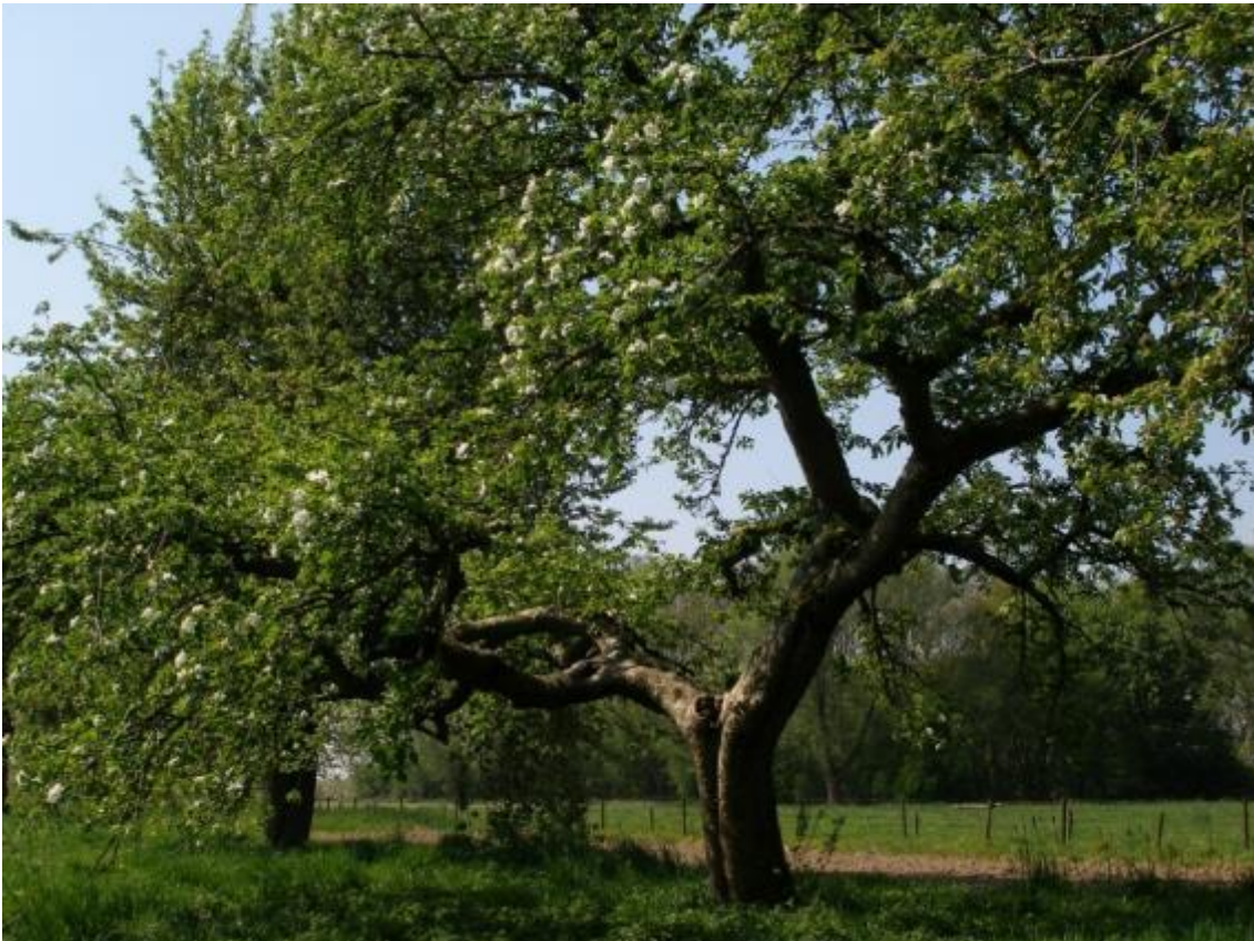
Oude appelboom in hoogstamboomgaard

Boomgaarden passen in het leefgebied Dooradering. Voorbeelden van doelsoorten zijn Gekraagde roodstaart, houtduif, kerkuil, spotvogel, steenuil en ingekorven vleermuis. Dit pakket kan worden afgesloten in hoogstamboomgaarden en halfstamboomgaarden.