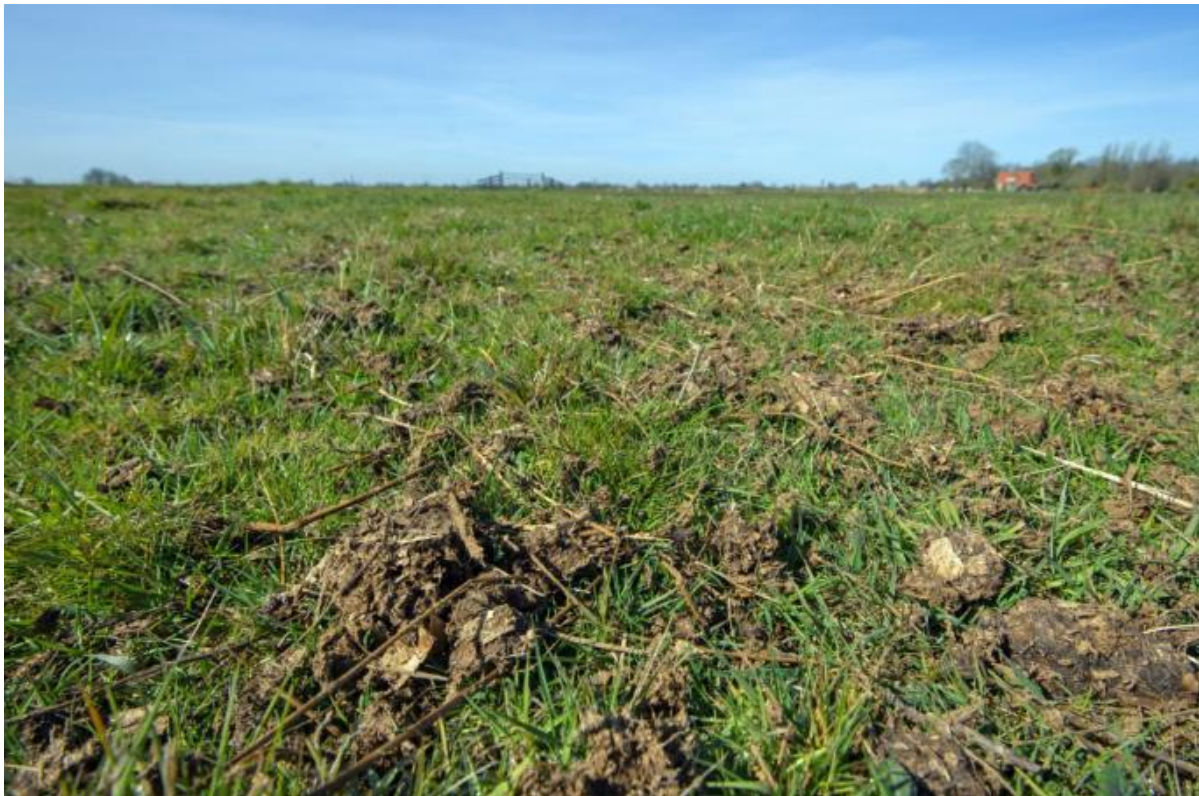
Ruige mest (foto https://www.livinglabfryslan.frl/ruge-dong-ofte-wel-ruige-mest/ )

Dit pakket is specifiek bedoeld voor boerenlandvogelbeheer en kan alleen in combinatie met andere, op broedvogels gerichte pakketten worden afgesloten. In pakketten t.b.v. bodemkwaliteit, water en klimaat is bemesting met ruige mest of andere bodemverbeteraars en plantenresten mogelijk via het pakket Bodemverbetering (pakket 39).