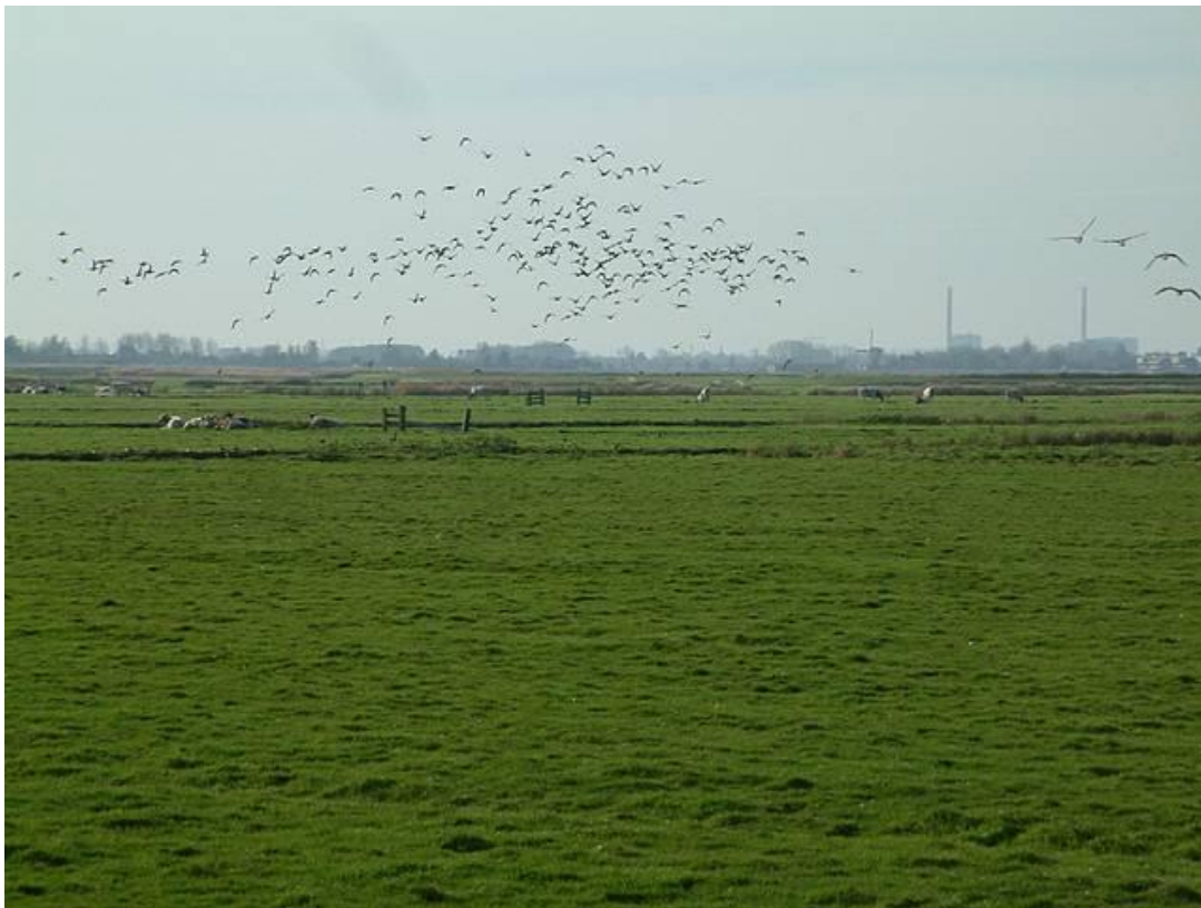
Weidevogellandschap ( https://nl.wikipedia.org/wiki/Weidevogel )

Voor Kievieten zijn een aantal pakketten met een vroegere rustperiode geschikt (vanaf 15 maart), de rustperiode loopt voor Kievieten ook eerder af, uiteraard alleen als er geen opgroeiende kuikens, ook niet van andere soorten, aanwezig zijn.