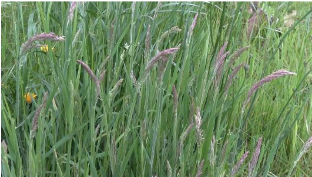
Witbol domineert hier de vegetatie, terugdringen door tweede helft mei te maaien

Dit pakket is bedoeld voor percelen waar je (extensief) kruidenrijk grasland wilt ontwikkelen, maar die nu nog zeer soortenarm zijn. Deze percelen worden bijvoorbeeld gedomineerd door witbol of bestaan nog geheel uit Engels raaigras. Verschralen van de bodem bevordert de kruidenrijkdom, dat wil zeggen dat er niet wordt bemest, er geen bagger wordt opgebracht en het maaisel wordt afgevoerd. Ook door beweiding achterwege te laten, voorkom je bemesting van het perceel en zorg je voor een snellere verschraling van het perceel. Vroeg maaien is van belang om het dominantiestadium van witbol te doorbreken, dan wel om zoveel mogelijk voedingsstoffen af te voeren. Omdat de eerste snede in het broedseizoen is, zal er naar nesten gezocht moeten worden.