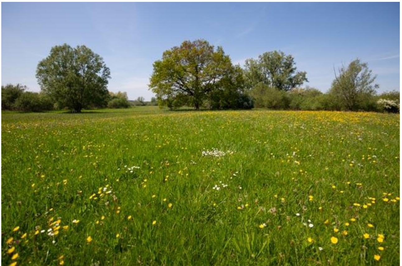
Botanisch grasland

Doelsoorten van de leefgebieden droge dooradering en open grasland waarvoor botanisch grasland meerwaarde heeft, onder andere: graspieper, patrijs, veldleeuwerik. Ook de kwartelkoning maakt gebruik van deze graslanden. Deze vogel broedt van ca. mei tot augustus, daarom is een rustperiode vanaf medio juni tot later in de zomer gewenst, dit kan via de pakketvarianten met rustperiode.