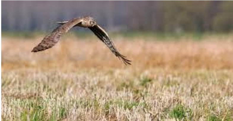
Graanstoppel met Blauwe Kiekendief

Stoppel, met name hoge stoppel, is waardevol voor akkervogels, zeker in combinatie met andere vormen van akkervogelbeheer in de omgeving. Akkervogels vinden hierin dekking én voedsel in de winter. Als stoppel of gewasresten door de winter ongestoord kan blijven liggen is dat heel aantrekkelijk voor zaadeters als veldleeuwerik, patrijs, geelgors en kneu, maar ook voor muizeneters als torenvalk, blauwe kiekendief en uilen. Een graanstoppel die tot en met het volgende groeiseizoen blijft liggen, biedt daar bovenop opgroei en foerageergelegenheid voor akkervogels.