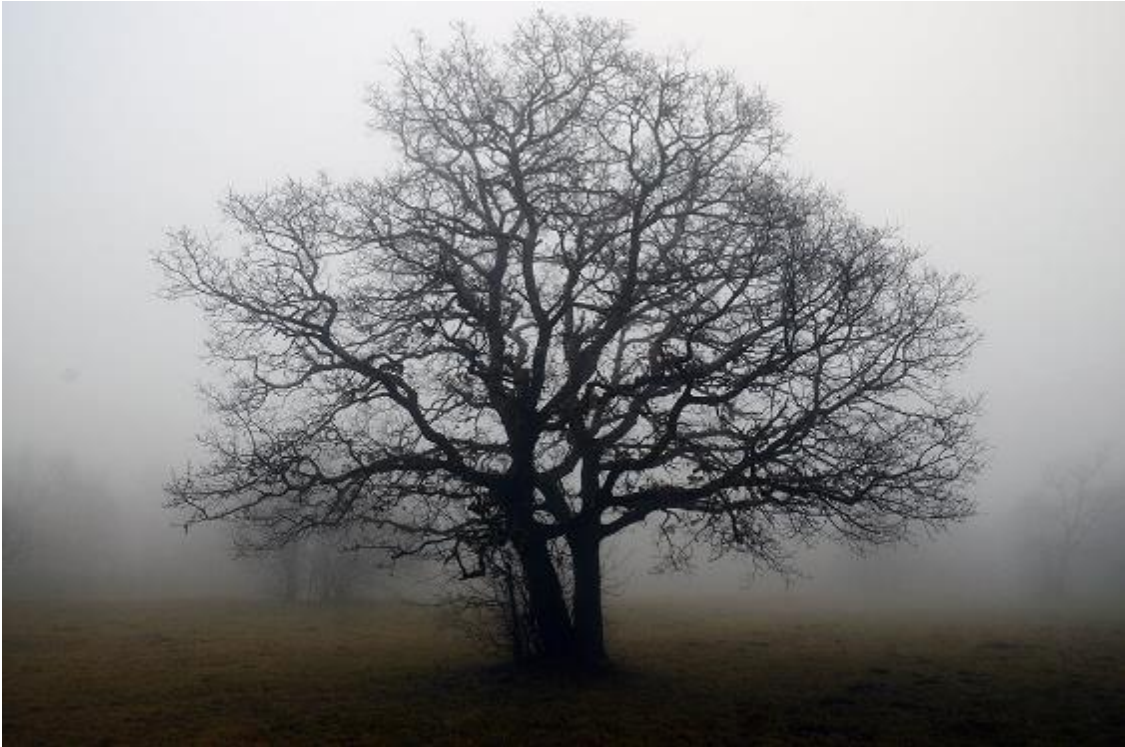
Solitaire boom ( https://www.landschapsfondshollandrijnland.nl/solitaire-boom/ )

Het verschil met beheerpakket 21 ( Beheer van bomenrijen ) is dat dit pakket kan overlappen met landbouwgrond. Beheerpakket 21 is een landschapspakket. Qua beheer lijken de pakketten wel sterk op elkaar.