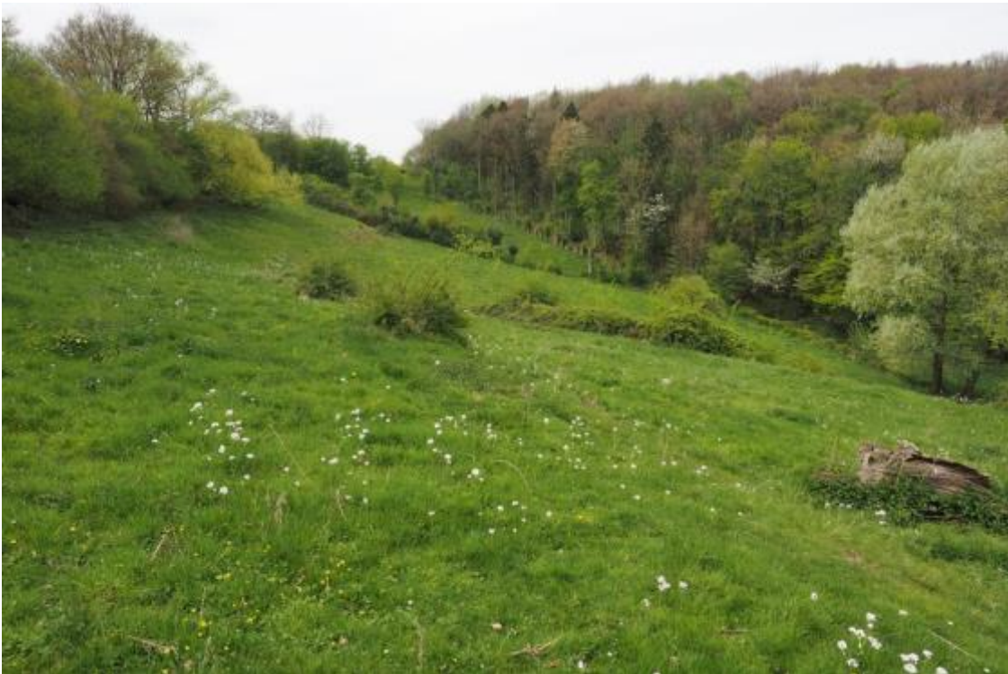
Grasland in Limburg ( https://www.naturetoday.com/intl/nl/nature-reports/message/?msg=23618 )

Dit pakket kan worden ingezet op graslanden met daarin de kensoort Grote pimpernel (in Limburg). Ook zijn er in deze graslanden veel mierennesten aanwezig (zoals knooppieren, gewone steekmier en moerassteekmier).