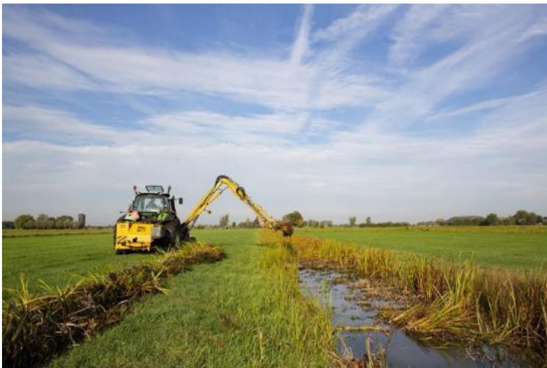
Ecologisch slootschonen

Baggerspuiten is bedoeld om delen van de sloot op diepte te houden. In dit beheerpakket moet dat met de baggerpomp, niet met de maaikorf, omdat dan de bodemvegetatie te veel beschadigd wordt.